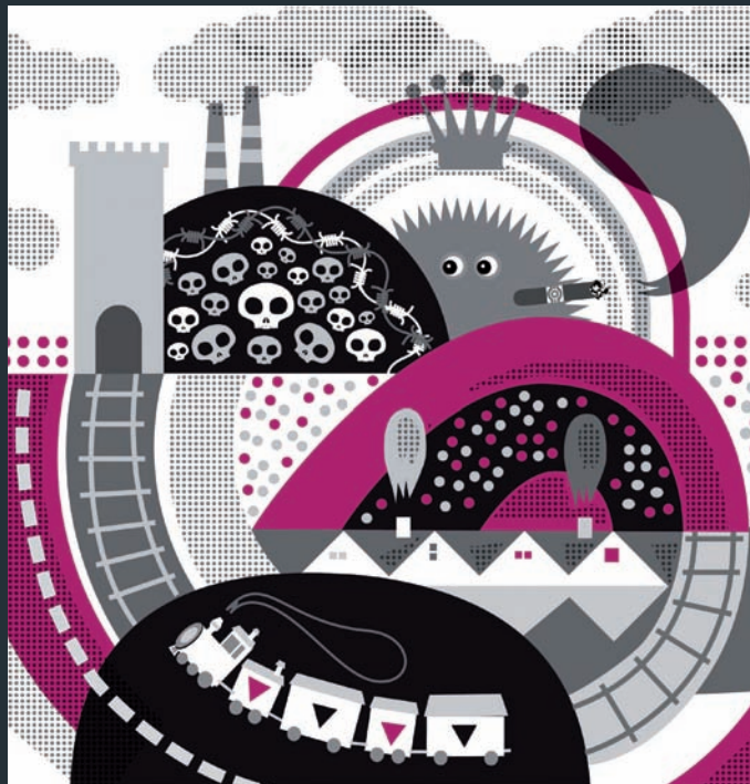
Muriel Holderith "Le petit train"